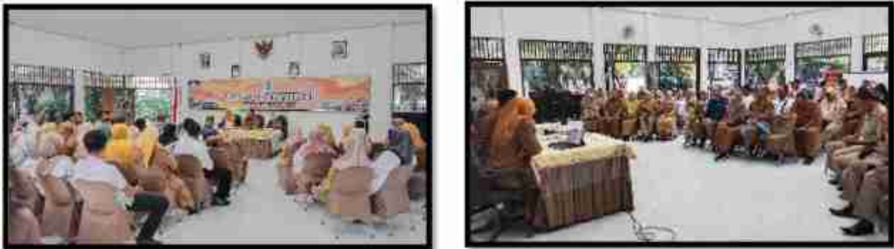
Gambar 1. Sosialisasi Internalisasi PUG