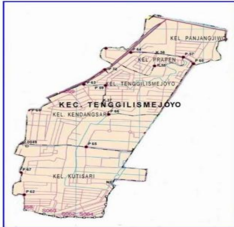
Peta Kecamatan Tenggilis Mejoyo Surabaya Timur

Kecamatan Tenggilis Mejoyo merupakan Kecamatan di Kota Surabaya Propinsi Jawa Timur, Indonesia. Kecamatan Tenggilis Mejoyo merupakan wilayah perkotaan yang dikelilingi oleh perdagangan dan pemukiman.